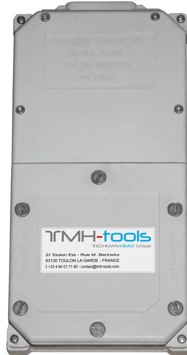
Location tag. Balise de géolocalisation.